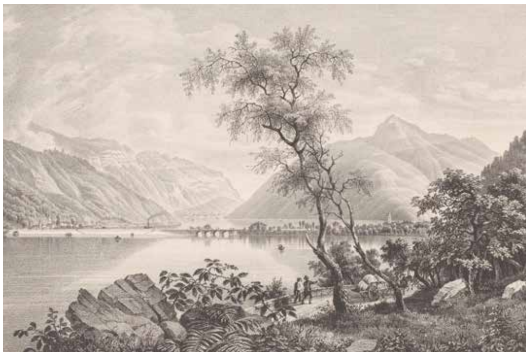
Il ponte diga fra Melide e Bissone sul Lago di Lugano