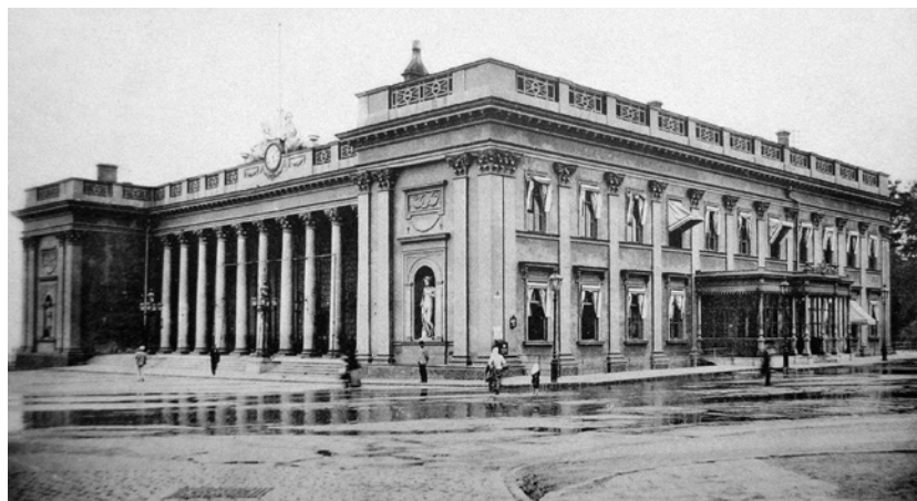
Il municipio di Odessa progettato da Francesco Boffo, allievo di uno degli architetti originari di Collina d'Oro

Val la pena di sottolineare la concezione dell'attività curata dal presidente Soldini. Da un lato, studi e pubblicazioni, affidate, come accennato, a istituti di ricerca di rango accademico. Grazie allo stanziamento di una borsa di studio triennale all'Archivio del Moderno è stato avviato lo studio dei fondi degli architetti della Collina d'Oro che hanno operato in Russia a cavallo tra il sette e l'ottocento. Il concetto di fondo era sostanzialmente quello di collocare nella loro giusta dimensione l'opera dei "nostri" architetti, evitando i facili quanto comprensibili entusiasmi e di incapsularli in un contesto locale senza coglierne il loro valore nel contesto europeo in cui hanno operato. Ora sappiamo chi sono stati gli Adamini, i Camuzzi, i Boffa (tra cui Francesco, tra i maggiori architetti di Odessa), Domenico Gilardi (oggi considerato tra gli artefici della ricostruzione di Mosca dopo le devastazioni napoleoniche).