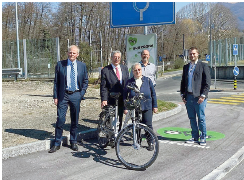
Un momento dell’inaugurazione ufficiale della ciclopedonale a Viglio

Il nuovo tracciato mette in sicurezza, con una barriera fisica, i ciclisti e i pedoni rispetto al traffico motorizzato, ciò che garantisce una maggiore sicurezza ai ciclisti in transito in quanto, in precedenza, il percorso ciclabile era incluso nella carreggiata stradale.