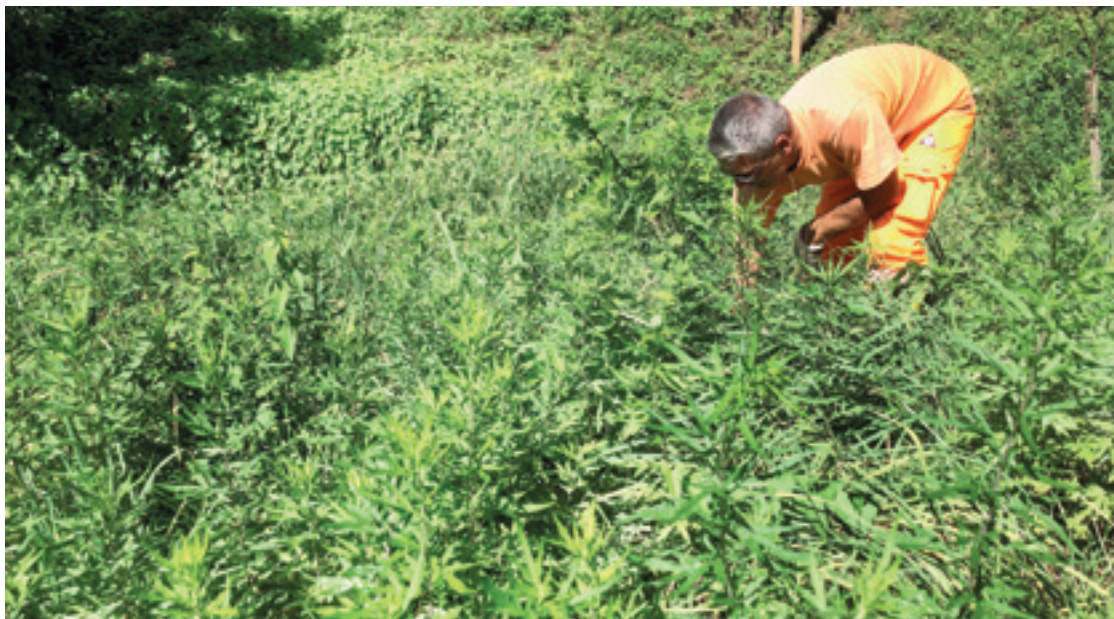
Interventi di estirpazione

Nell'ambito di questo progetto, sono state dapprima rilevate a tappeto le principali neofite presenti nel comprensorio comunale; in seguito, sono stati definiti degli obiettivi concreti e valutati degli interventi tecnicamente sostenibili che non prevedessero l'impiego di erbicidi chimici. La strategia attuata era basata sulle priorità (specie più problematiche, luoghi sensibili, interventi secondo lo stato più recente delle conoscenze), e con un approccio costi-benefici. Tra le neofite prioritarie, il piano di gestione prevede interventi contro quattordici specie, tra cui ad esempio l'ailanto ( Ailanthus altissima ), una specie arborea che crea molti problemi nei boschi soppiantando le specie autoctone. Sempre nei boschi, sono previsti interventi anche contro la palma di Fortune ( Trachycarpus fortunei ), la quale partendo dai giardini sta cambiando il volto del sottobosco. Per contenere questa specie, la partecipazione dell'intera popolazione è fondamentale: chi non vuole rinunciare alla palma nel proprio giardino, deve essere consapevole che il taglio delle infiorescenze ogni anno nel periodo di fioritura (maggio-giugno) permette di evitare un'importante produzione di frutti e la conseguente diffusione della specie in natura. Parallelamente agli interventi di gestione, sarà promossa una campagna di sensibilizzazione nei confronti della popolazione e anche un monitoraggio dei focolai, con lo scopo di verificare l'efficacia degli interventi intrapresi.