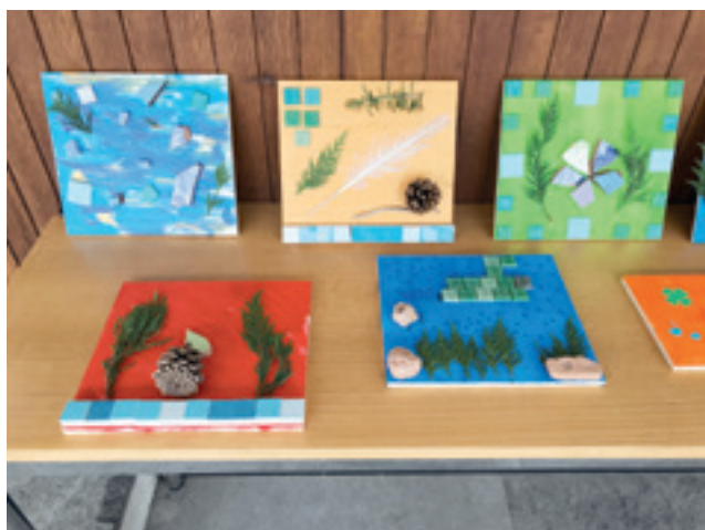
Alcuni lavori realizzati durante gli atelier di attività creative

rametti. È stato pure possibile dare origine a simpatici polpi da una semplice bottiglia di PET, decorati con nastri, capsule del caffè, carta colorata e altri semplici materiali messi a disposizione dei bambini. Piatti di carta si sono trasformati in divertenti animaletti con qualche tocco di pennarello e pochi tagli di forbici.