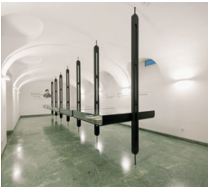
Il nuovo allestimento della Sala espositiva Pasquale Lucchini a Gentilino