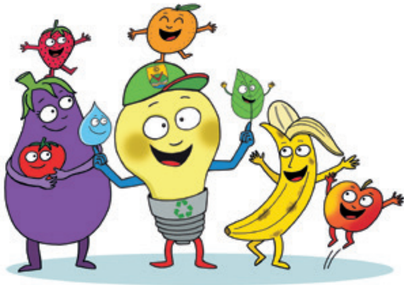
Lucio e Lina, le mascotte del progetto

Con Movimento e gusto, con l'equilibrio giusto , la scuola si propone dunque di affiancare le famiglie nel fornire ai bambini strumenti e competenze fondamentali, da utilizzare ora e in futuro per una lunga vita sana e in salute.