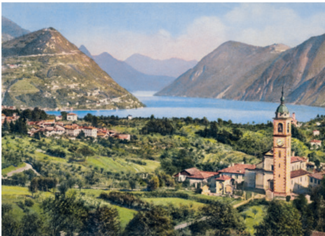
Vista sulla chiesa di Sant'Abbondio, sullo sfondo il nucleo di Gentilino Timbro postale: 5.6.1940

documentando le modifiche urbanistiche e le trasformazioni architettoniche degli edifici nel corso dei decenni.