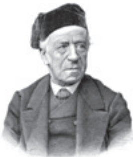
Pasquale Lucchini, 1798–1892

Inaugurata lo scorso settembre la sala espositiva a lui dedicata e la mostra che ripercorre la vita intensa e straordinaria del noto ingegnere e imprenditore.